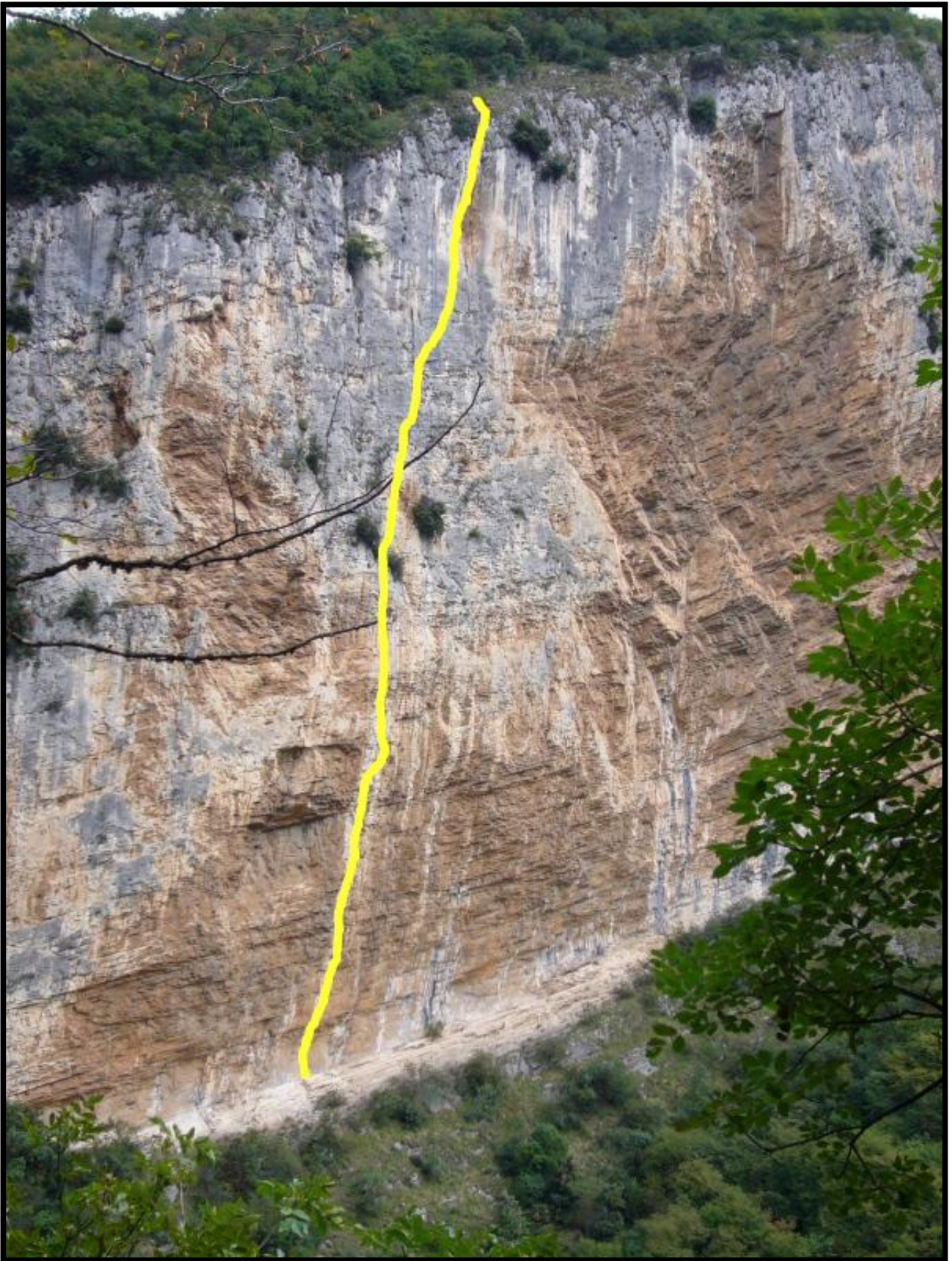
“Destini incrociati” - tracciato